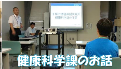
健康科学課のお話