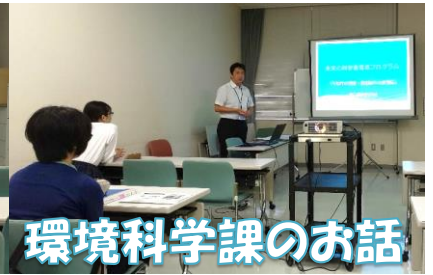
環境科学課のお話