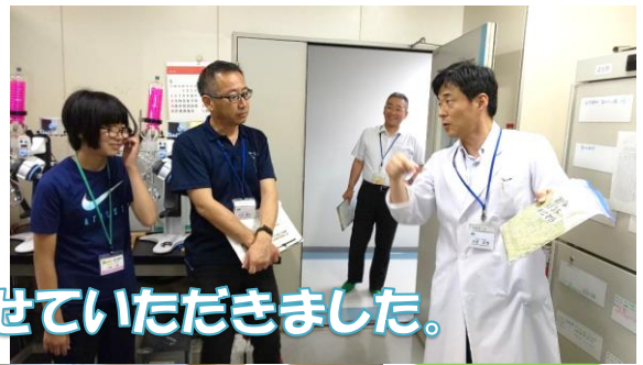
研究に使用する様々な機械を見せていただきました。