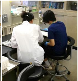
千葉市内の河川の水質調査その2 (DO測定)