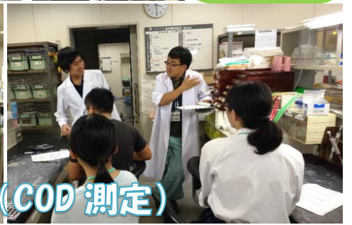
千葉市内の河川の水質調査その1 (COD測定)