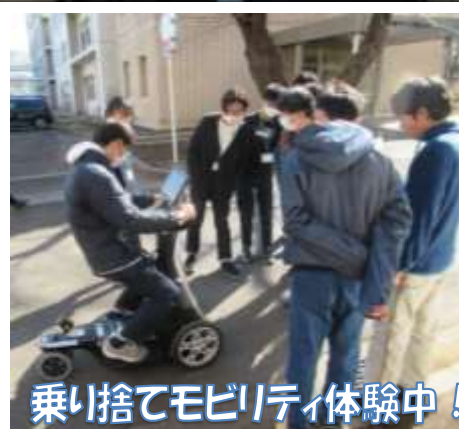
乗り捨てモビリティ体験中！