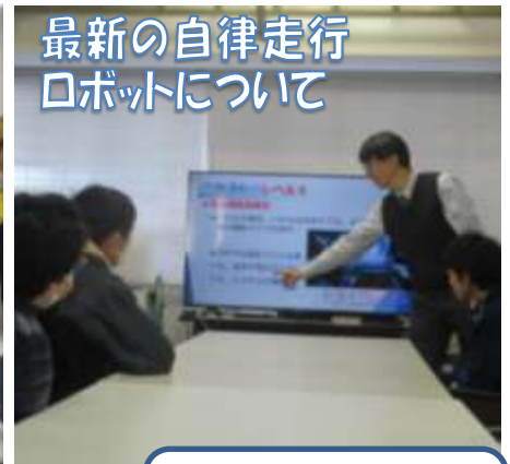
最新の自律走行 ロボットについて