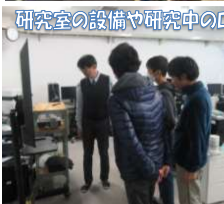
研究室の設備や研究中のロボットに興味津々の受講生