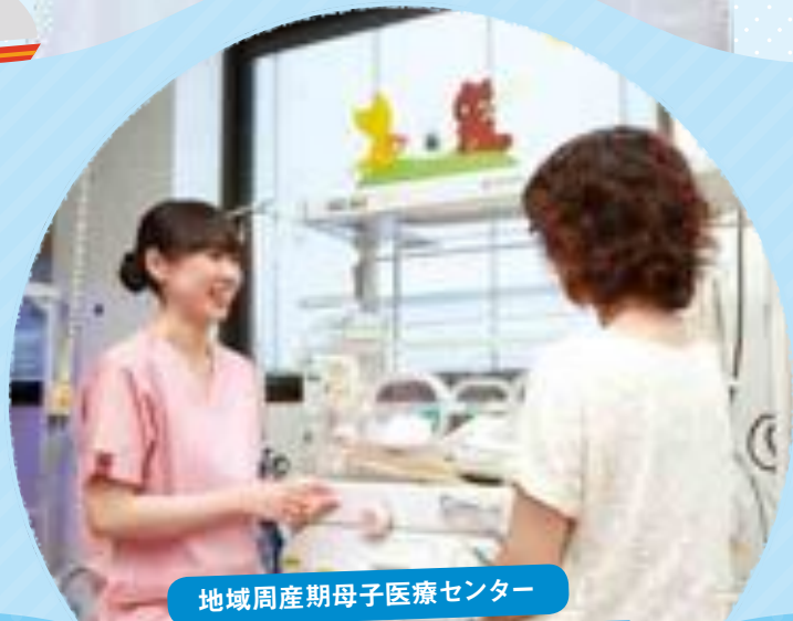
地域周産期母子医療センター