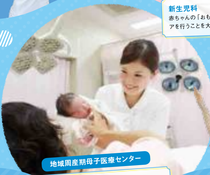
地域周産期母子医療センター

赤ちゃんの「おもい」を知り、ご家族とともにケアを行うことを大切に看護しています。