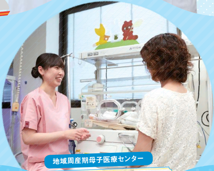
地域周産期母子医療センター