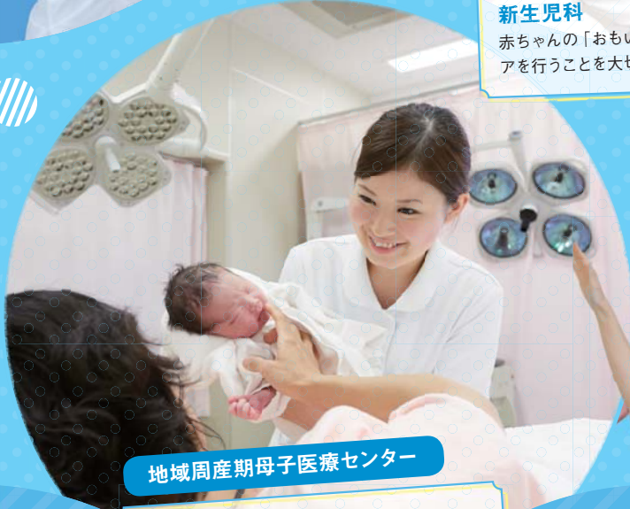
地域周産期母子医療センター

赤ちゃんの「おもい」を知り、ご家族とともにケアを行うことを大切に看護しています。