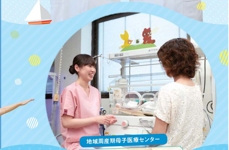
地域周産期母子医療センター