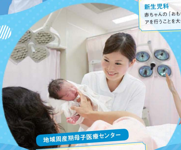
地域周産期母子医療センター

赤ちゃんの「おもい」を知り、ご家族とともにケアを行うことを大切に看護しています。