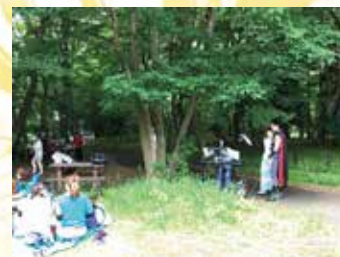
おゆみ野の森の音楽祭