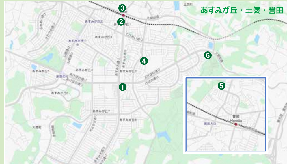
@open street map