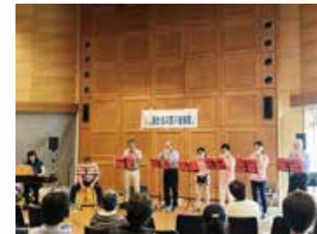
ほたるの里の音楽祭