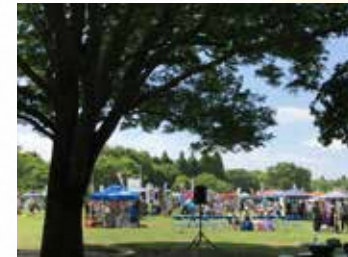
土気 ROCK 祭