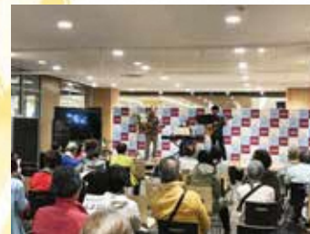
ゆみーるふれあい音楽祭