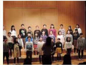
おゆみ野文化祭ハーモニーフェスタ