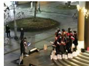
キャンドルナイト