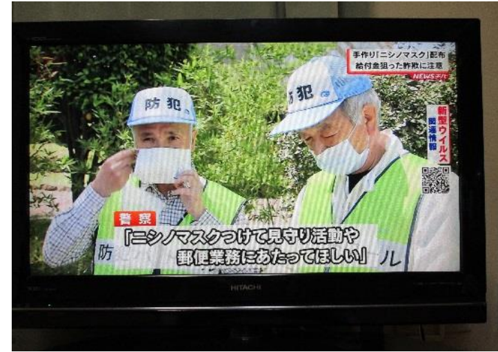
ニシノマスクをつける様子をTVが放映