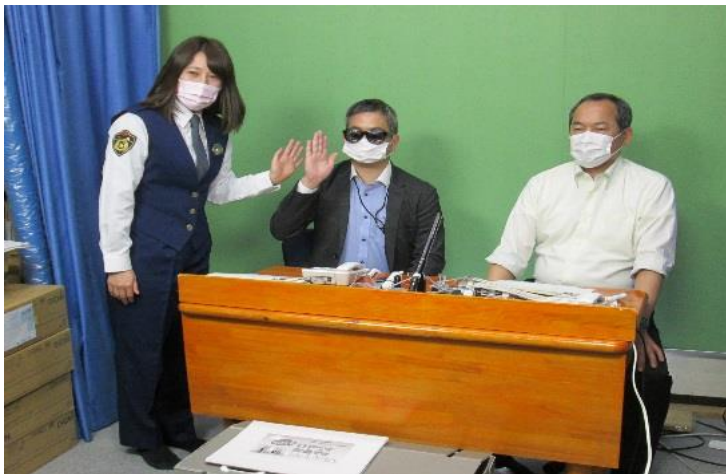
電話で詐欺に注意をと呼びかける警察署員 (ガーデンタウン有線テレビ放送で)