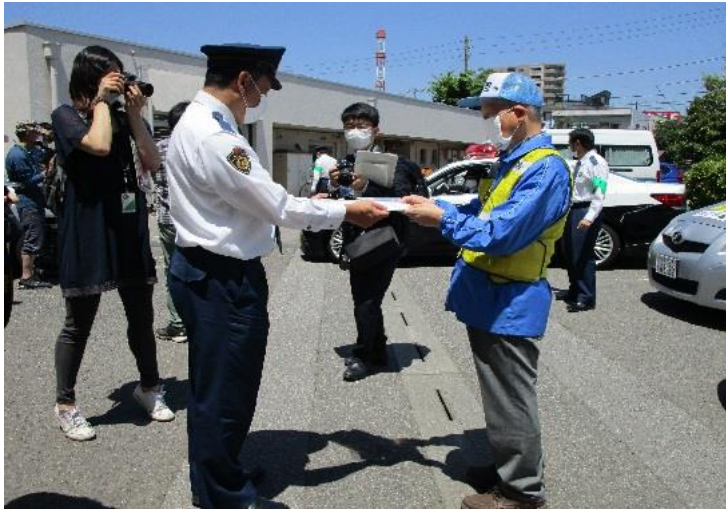
ニシノマスク贈呈式