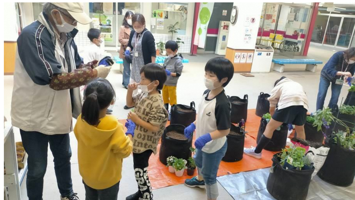
高洲第一ショッピングセンターでの 植替え イベントの様子 ②