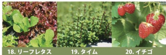
18. リーフレタス 19. タイム 20. イチゴ