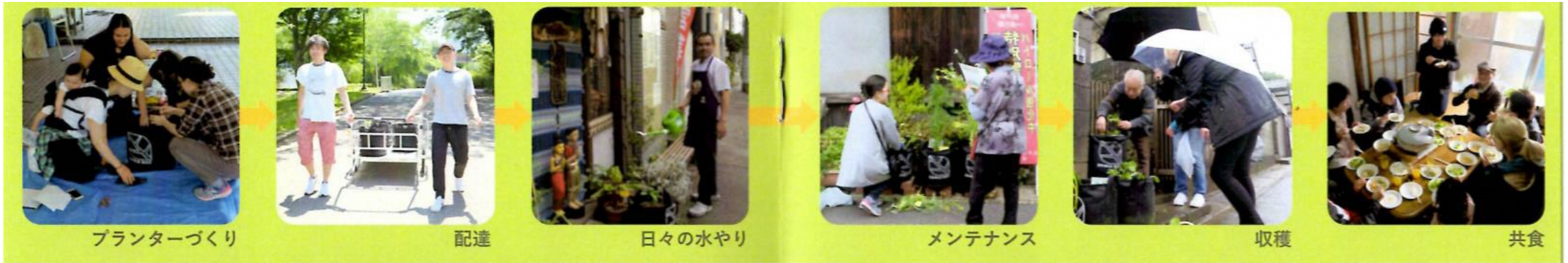
プランターづくり

多世代の交流、中高年の引きこもり・孤独死・地域のイメージ低下・外国人居住者との習慣や言語の違いによるトラブルなどの解消、、、