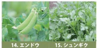
14. エンドウ 15. シュンギク