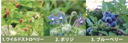
1. ワイルドストロベリー 2. ポリジ 3. ブルーベリー

「エディブルガーデン」は、直訳すると「食べられる庭」。野菜、ハーブなど、食べられる植物が植えてあります。植物は、互いの成長を助け合うコンパニオンプランツ（共生植物）の組み合わせです。花や実の美しさ、収穫の楽しさ、食べる喜びをわかちあうことができます。野菜の成長を観察して楽しんでみてください！