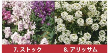
7. ストック 8. アリッサム