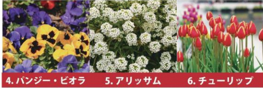
4. バンジー・ピオラ 5. アリッサム 6. チューリップ

ポリジは、蜜源植物でミツバチを集め、受粉を助ける・害虫を防ぐ・ブルーベリー、イチゴと相性が良い