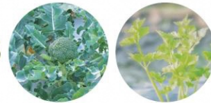
ブロッコリー+セロリ