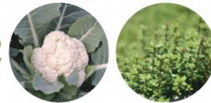
カリフラワー+タイム