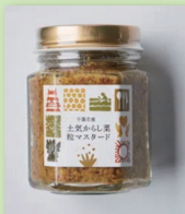
土気からし菜粒マスタード