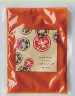
アラベサのトマトソース