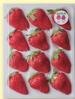
さんたファームのこだわりいちご