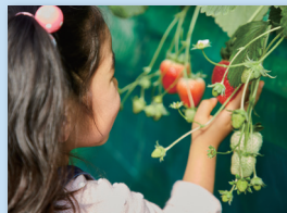
千葉市イチゴ観光農園のイチゴ狩り