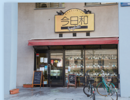
レストラン今和による地域と食の活性化への取り組み