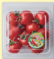
てっちゃんの完熟ミニトマト