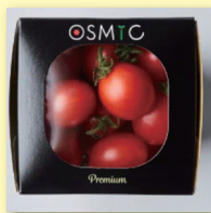
OSMIC TOMATO mini 「Premium」