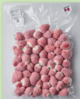
さんたファームのこだわり冷凍いちご