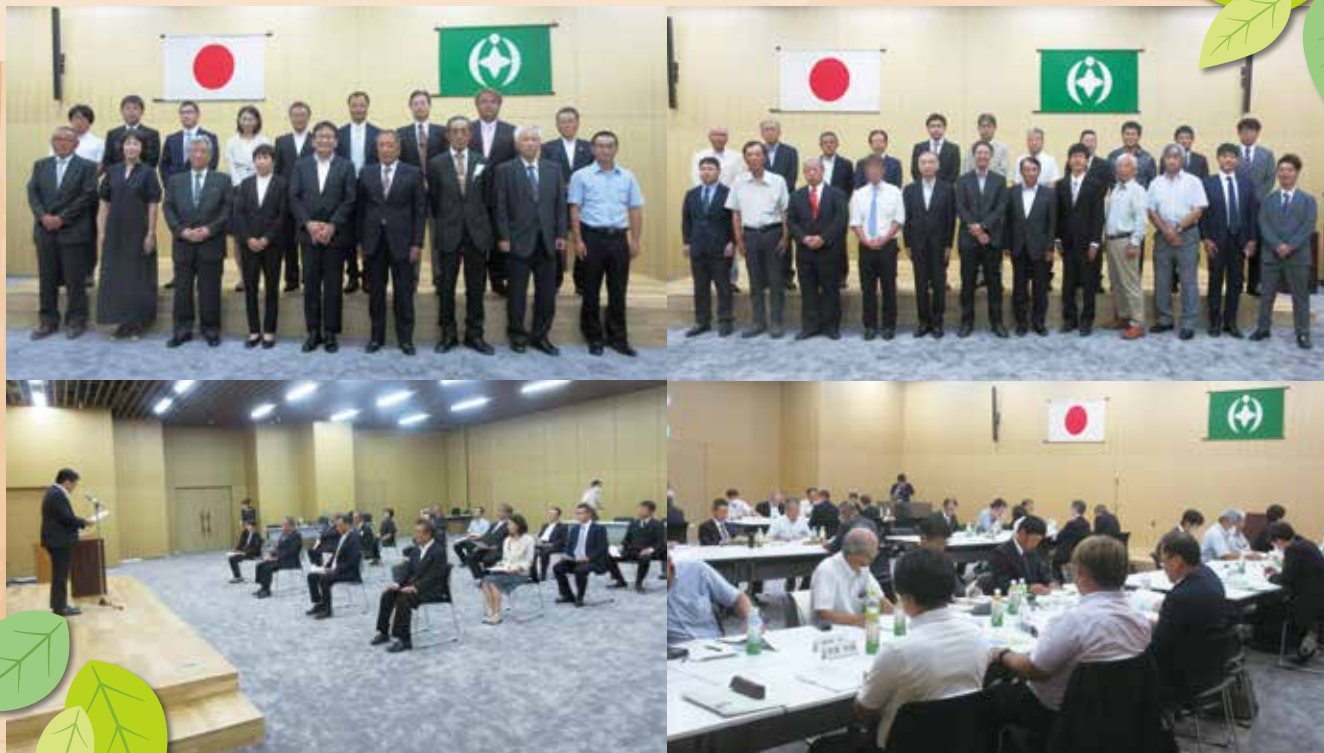
任命式・農業委員農地利用最適化推進委員合同説明会（令和5年7月20日）

第 145 号 https://www.city.chiba.jp/nogyo/dayori.html