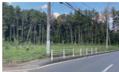
令和2年度に全伐 同3年度にナラ、クヌギ等を植栽 同4年度から下刈りを実施