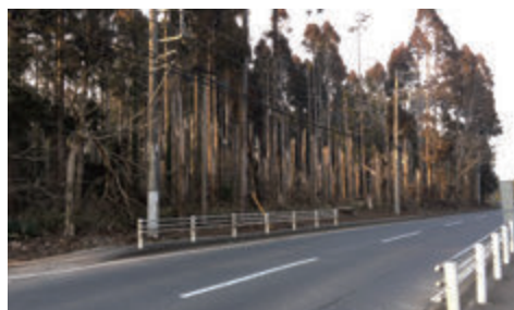
令和元年の台風15号により多数のスギが倒れ、一部が電線にかかった。