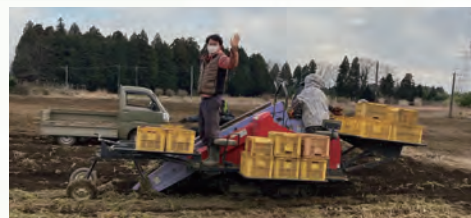
エンジンの収穫風景