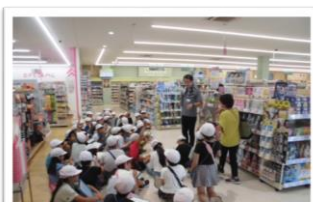
3年校外学習(お店見学)