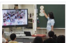
栄養教諭による保健の学習