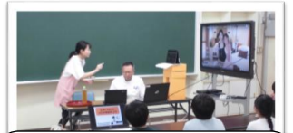
5年いのちを守る教育