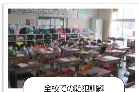
全校での防犯訓練