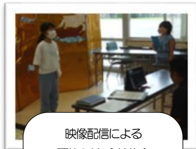
映像配信による 夏休み前 全校集会