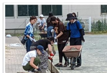
夏休み中に、PTAボランティアによるグラウンドの側溝掃除が行われました！ありがとうございました。