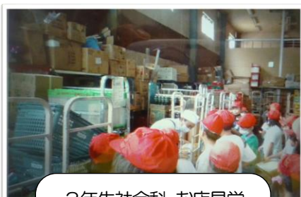
3年生社会科 お店見学