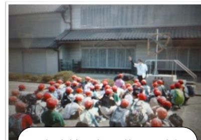
4年生校外学習 佐原のまち