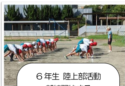
6年生 陸上部活動 朝練習始まる