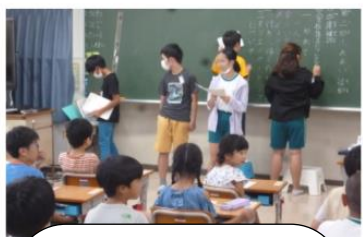
全校遠足に向けた 第2回ふれあい活動