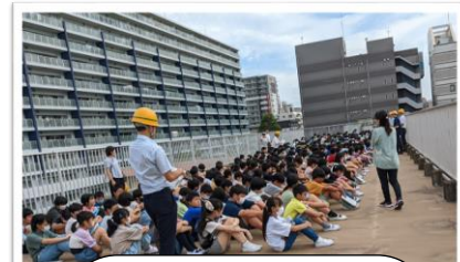
6年生 津波を想定した 分教室での避難訓練