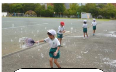
夏を楽しみながら 1年生生活科「水遊び」