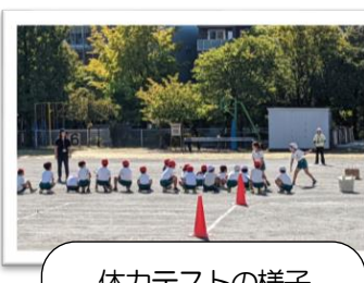
体力テストの様子