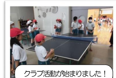
クラブ活動が始まりました!