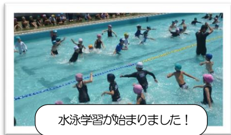
水泳学習が始まりました!