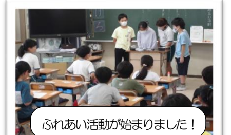
ふれあい活動が始まりました!