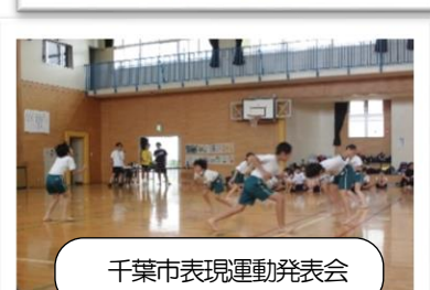
千葉市表現運動発表会