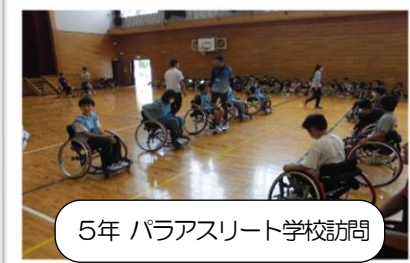
5年 パラアスリート学校訪問