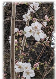
ふれあいの道の桜

このたびの定期異動により、6名の職員が転任することとなりましたので、お知らせいたします。在職期間中はたくさんのお力添えをいただき心より感謝申し上げます。今後とも本校の教育活動にご支援とご協力を賜りますようお願い申し上げます。