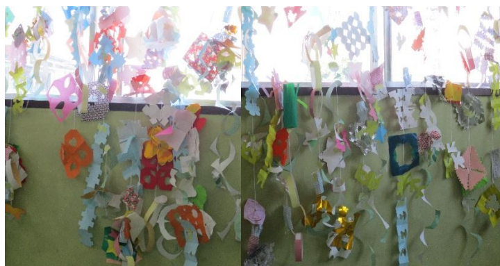
1年生図工【ちょきちょき飾り】 形や色合いが様々あり、個性豊かな作品です。

いろいろな場面を想定した言葉かけを受け、考えながら学習を進めました。「服を着ていると、思っている以上に動けない。」などの感想がありました。ペットボトルや木などを使って助けがくるまで、慌てずに待つことも学びました。