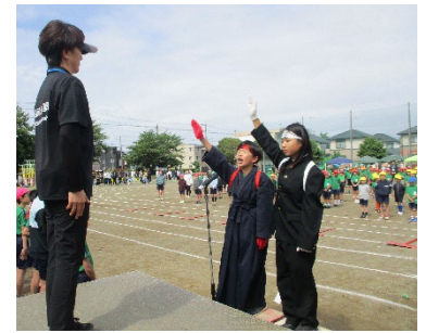
今年も応援団が運動会を盛り上げました。応援団のかっこよさがたくさん見られました。

また、5月29日、30日1泊2日で6年生が日光・鬼怒川方面に修学旅行に行ってきました。伝統的な木彫り体験、世界遺産「日光東照宮」での歴史探索、足尾銅山ではトロッコに乗り坑道内を見学、そして優美な華厳の滝を間近でみることができ、貴重な時間を仲間と過ごすことができたと思います。保護者の皆様、ご支援・ご協力ありがとうございました。