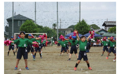
1年生は初めての小学校での運動会。2年生と一緒に元気よく笑顔あふれるダンスを披露することができました。