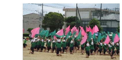
高学年「らしさ」を体現した組体操とフラッグ運動。息の合った美しい表現に、誰もが心を奪われました。