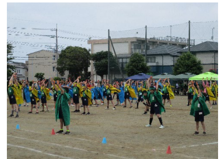
力強いかけ声とキレのある動きがかっこよかった3・4年生。心を一つに踊りきり、大きな成長を感じさせました。