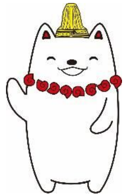
加曾利貝塚PR大使 かそりーぬ