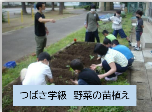
つばさ学級 野菜の苗植え

つばさ学級は、野菜の苗を植えました。「ミニトマト」「キュウリ」「ナス」「オクラ」を植えました。一本一本でいねいに植え、優しく土をかけていました。