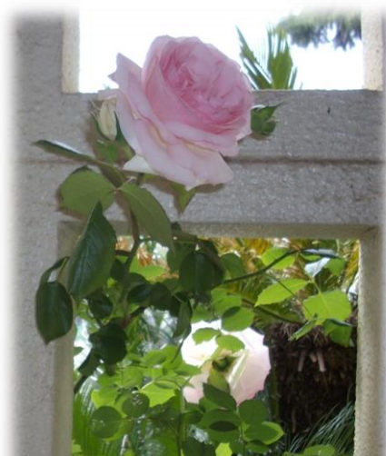
職員玄関前に咲いたバラ

長期にわたって、制約のある生活が続く中で、不安やストレスを感じたり、元気がでなかつたりする子どもも少なくないと思います。見守る保護者の皆様にとっても、たいへんな毎日かと思いますが、子どもたちが健康で規則正しい生活が送れたり、めあてをもって計画的に学習に取り組んだりできるよう、引き続きご協力をお願いいたします。