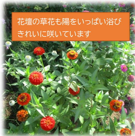
花壇の草花も陽をいっぱい浴び きれいに咲いています