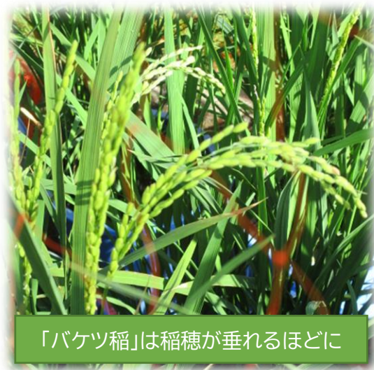
「バケツ稲」は稲穂が垂れるほどに