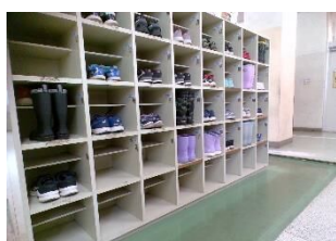
昇降口はたくさんの友達が使います。思いやりが大切ですね。

先日、教室をまわっていた際に、机といすがきちんと整頓されている教室がありました。図書室で学習をしているようで人の姿はありません。図書の学習の後、子供たちは気持ちよく教室に戻り、次の学習を落ち着いて始めることができたに違いありません。昇降口に目を向けると、脱いだ靴は自分の靴箱にきちんと置かれています。雨の日の傘立も、傘がくると上手にまとめられ、後から来た人が掛けやすいようになっていることが多いです。日々の暮らしの中でこのような気遣いができる桜木小の子供たちは素敵です。これらの行動を認め、褒めることで、日常化を図っていきたいと思います。ご家庭でもご協力をお願いします。