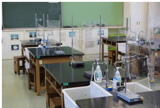
理科室にはアクリル板を設置