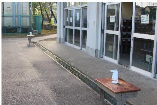
校内に入る前に消毒