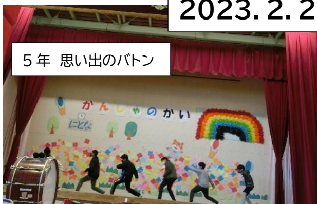
5年 思い出のバトン