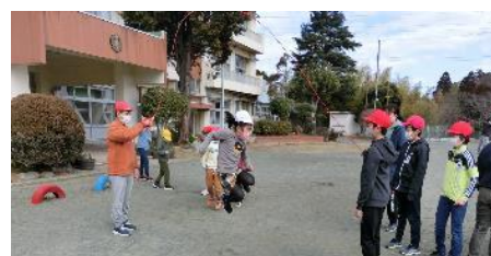
ふれあい活動～長縄大会～

令和5年4月以降、小学校等給食の調理・洗浄を行う調理員をしていただける方を募集しています。調理経験や調理師免許の有無は問いません。小学校等の給食会計年度任用職員を希望される方は、勤務条件を示した用紙を学校から受け取り、応募票に記入して学校までご提出ください。不明な点については、 千葉市教育委員会保健体育課（043-245-5945） までお問い合わせください。