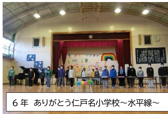
6年 ありがとう仁戸名小学校～水平線～

令和4年度が締めくくられます。保護者の皆様、地域の皆様のおかげでさらに大きく育った子どもたちです。この1年間、無事に教育活動を進めることができました。