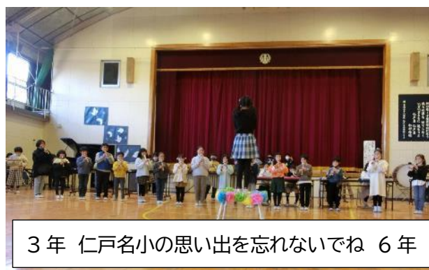
3年 仁戸名小の思い出を忘れないでね 6年