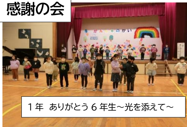
1年 ありがとう 6年生～光を添えて～