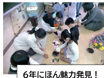
6年にほん魅力発見！