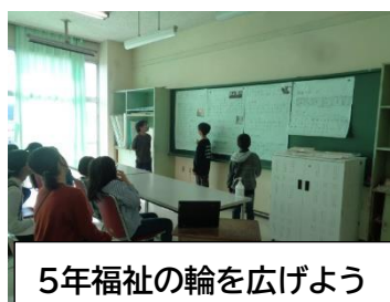
5年福祉の輪を広げよう