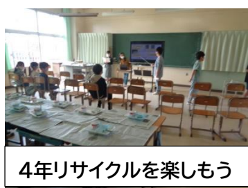
4年リサイクルを楽しもう