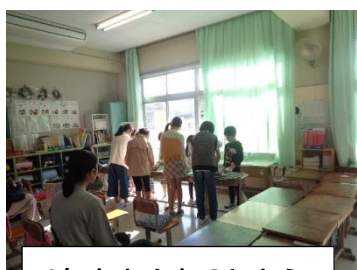
1年あきをたのしもう

小春日和の気持ちのよい一日、ハッピー東デーが行われました。子どもたちは生活科・総合的な学習の時間でそれぞれが学習したことを、グループで力を合わせて発表しました。どの子どもも自分の課題に向き合い、調べ、表現しました。私は全てのクラスを参観しましたが、子どもたちが自信をもって、学習したことを自分のものとして披露している姿に感動しました。また、参観している方も積極的に感想を言っている姿に感心しました。これらの学習を通して、人間関係形成・社会形成能力、課題対応力も育ちます。教職員も、子どもたちが力を発揮できるよう、尽力していました。ご家庭でも励ましていただいたことでしょうか。ありがとうございました。頑張った子どもたち、大いにほめてあげてください。