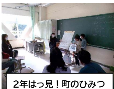
2年はっ見！町のひみつ