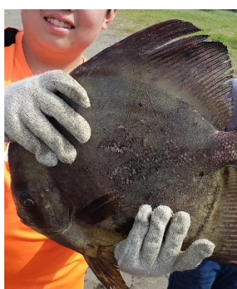
6年生地引網 大漁! 大きなヒラメ