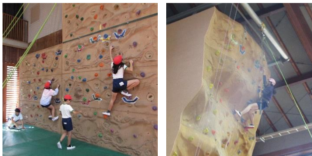
5年生の大挑戦 クライミングウォール(3m/9m)