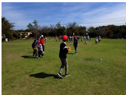
【全校遠足：鷹の台公園】