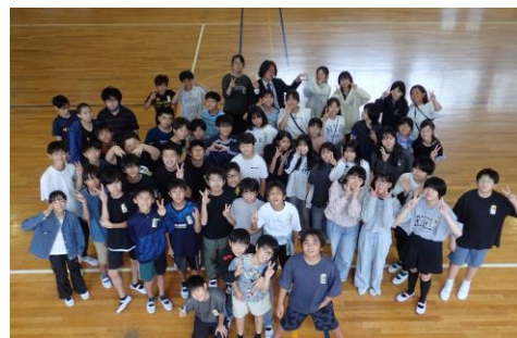
【前期終業式での学年音楽発表を終えて(6年)】