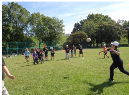
【全校遠足：千城台公園】

季節の変わり目となりますので、皆様どうぞご自愛ください。今月も、子どもたちの笑顔が輝く学校であるために、教育活動に邁進してまいります。今後とも、皆様の変わらぬお力添えを賜りますよう、心よりお願い申し上げます。