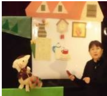
2/4 1～5年 人形劇鑑賞

2月4日(水)に本校の家庭科・図工専科講師が参加している人形劇団「なんだろな」による人形劇を、1～5年生が鑑賞しました。劇の前に英語によるダンスなどをして体も心もほぐして、にこにこ劇を楽しんでいました。