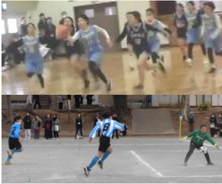
1/21 千葉市小学校球技大会

1月21日(水)に、千草台小学校、都賀小学校と本校の3校が千草台小学校に集まり千葉市小学校球技大会を開催しました。結果としては、サッカーとバスケットボールとも1勝1敗で2位という結果でした。子供たちは、12月の練習試合の時と比べると、すごく力を伸ばしていました。今年はアウェーで、千草台小の応援に取り囲まれる中、それに負けずに味方を応援する