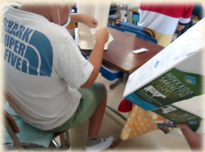
【6年生】 集めていただいた牛乳パックで「ファイルスタンド」を作りました。その後飾りつけをして・・・