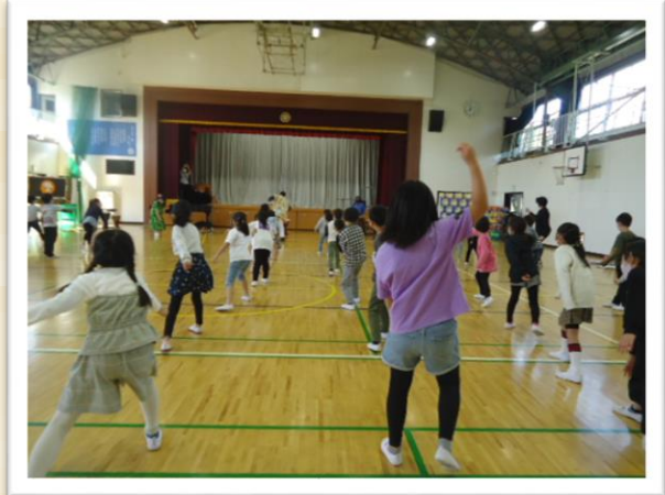
音楽に合わせてダンスも踊りました。大きく体を動かし、アフリカのリズムに乗ることができました。