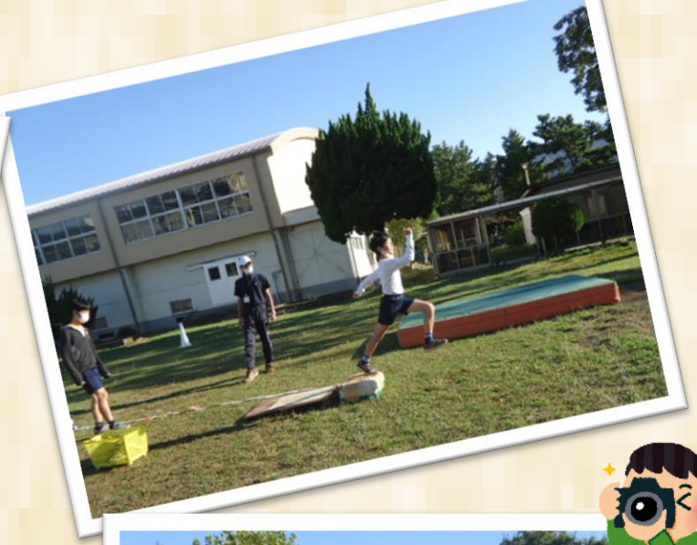
陸上の朝練習を開始しました。記録を伸ばせるように、がんばりましょう！