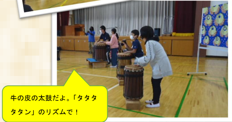
牛の皮の太鼓だよ。「タタタタタン」のリズムで！