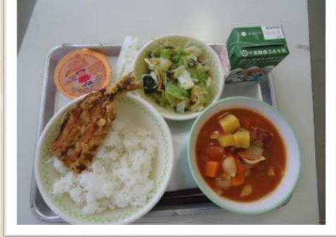
10/18 (月) 千葉市民の日になんだ献立 ごはん、牛乳、いわしの更紗揚げ、秋色ドレッシングがけ、和風ミネストローネ、ちはなちゃんゼリー