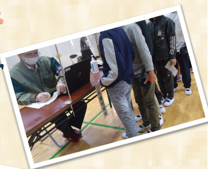
いよいよ投票です。入場整理券を渡し、投票用紙を受け取りました。記載台で投票用紙に記入します。