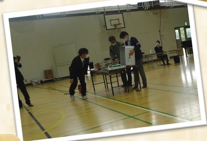
開票の結果、「公園を建設したい」と述べた候補者が当選しました。選挙によって一人一人の票が市政に反映されていくことが実感された瞬間でした。最後は、民主主義にとって選挙が重要な役割を果たしていることなどのお話がありました。