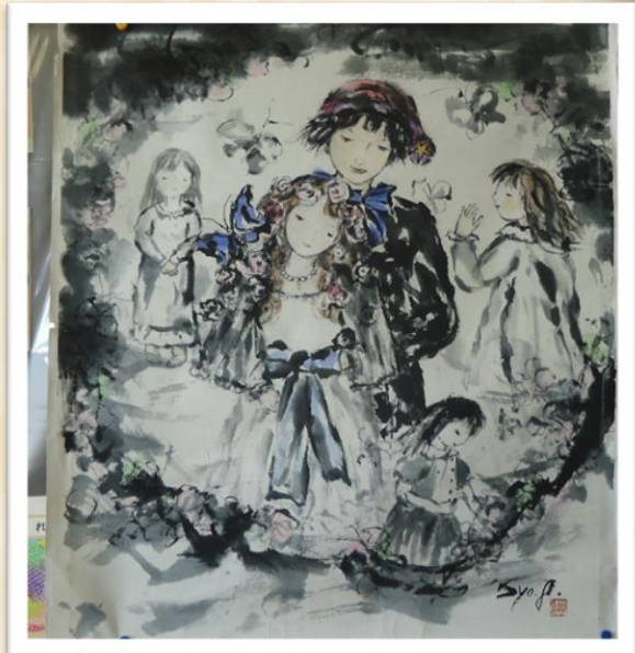
藤田正子先生 の作品です。