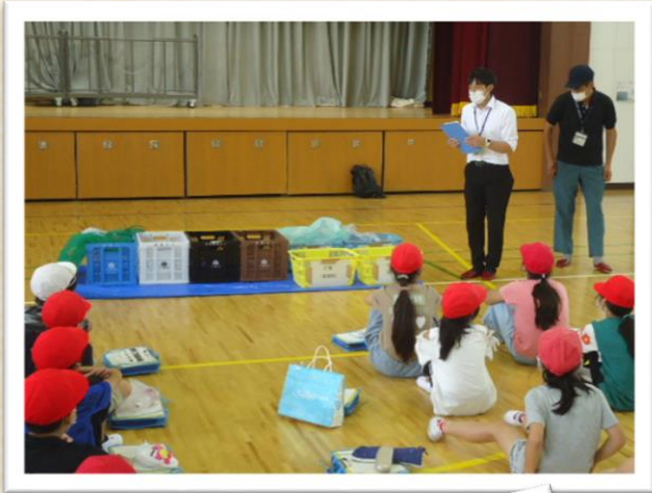
4年生が「ゴミ分別スクール」で、 ごみの出し方について学びました。