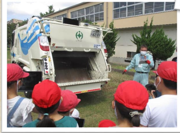
ごみ収集車を間近で見ました。強い力でごみをつぶ しながら回収する様子に、目を丸くしていました。