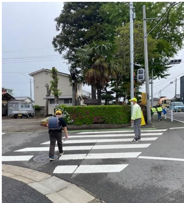
登校中の児童を見守る セーフティウォッチャーさん