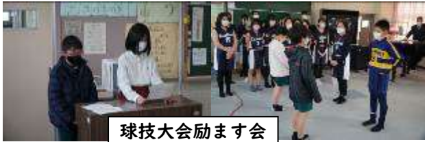
球技大会励ます会

1月25日(水)、厳しい寒さの中でしたが、3年ぶりに球技大会が開催されました。花見川小学校を会場に、花見川第三小学校・花島小学校・花見川小学校と本校の4校で、2回ずつ対戦しました。6年生はこれまでの練習の成果を発揮し、全力でプレーをする姿が見られました。