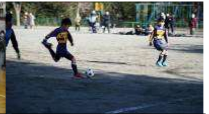
パスがつながりシュート！