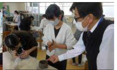
6年生 陶芸教室 世界で一つだけの自分の器を 作りました。焼き上がりが楽し みですね。