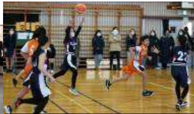
懸命にボールを追いかけてました