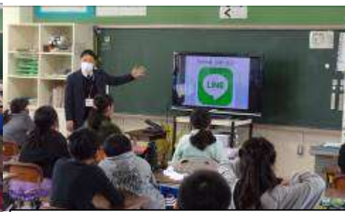
5年生 ネット安全教室 SNSやネットゲームで気を付けるこ とについて事例をもとに学びました。