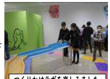
つくりかけラボを楽しみました

1月14日（水）に3年生が千葉市美術館の鑑賞教室に参加しました。常設展や「つくりかけラボ」などを鑑賞したり、美術館のいろいろな場所を見学したりして、美術館をすみずみまで探検していました。「今度は家族で行きたい。」という声も出ていました。