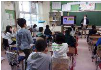
4年生 ネット安全教室 ネットを安全によりよく利用 する方法を学びました。