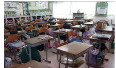
教室でのシェイクアウト訓練の様子

1日(木)の2校時に実施しました。千葉市の訓練放送を聞き、各学級で「DROP(まずひくく)」「COVER(あたまをまもり)」「HOLD ON(うごかない)」の安全行動をとることができました。校庭への避難は、雨天のため中止し、校舎内の避難経路を確認しました。ご家庭でも、避難場所や避難経路の確認など、非常時について話題にしていただければと思います。