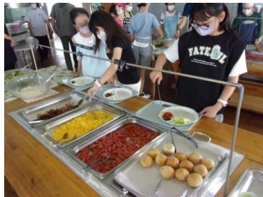
ビュッフェスタイルの食事

充実した2泊3日になりました。到着したときに鴨川の海を見て、子どもたちは歓声を上げていました。カッター訓練では、声と力を合わせて一体感を味わっていました。鴨川シーワールドでは、シャチの迫力ショーを楽しみました。仲良く、約束を守って生活する6年生の姿に頼もしさを感じました。