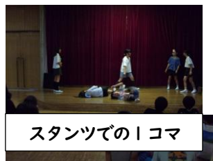
スタンツでの1コマ