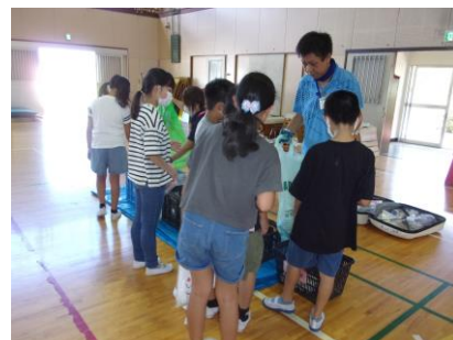
ごみを分別している様子