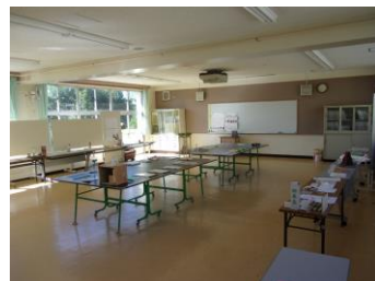
多目的室 4～6年生 たけの子

子供たちは、学級ごとに作品を見る機会をもちました。友達の論文のまとめ方の良いところに気付いたり、工作の工夫した点を見付けたりしていました。