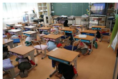
教室での避難訓練の様子

校庭への避難は、暑さ対策のため中止し、校舎内の避難経路を確認しました。ご家庭でも、避難場所や避難経路の確認など、非常時について話題にしていただければと思います。