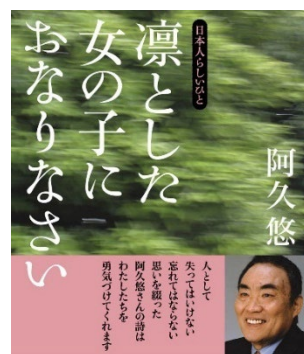
著者 阿久 悠（暮しの手帖社）

上記の見出しは、昭和の作詞家、阿久悠さんの本のタイトルです。阿久さんをご存知でしょうか。有名どころでは、「また逢う日まで」（尾崎紀世彦）、「北の宿から」（都はるみ）、「勝手にしやがれ」（沢田研二）、「UFO」（ピンク・レディー）、「雨の慕情」（八代亜紀）などを手がけました。他にも挙げればキリがありません。そんな著名な作詞家である阿久さんの晩年は、若者に対する特別な思いを抱いており、ご自身の反省も込めて、この本を残しました。ここには9編の詩（日本人らしいひと①～⑨）が掲載されています。どれも、昭和の時代の子どもたちが成長していく過程で、あるべき世の中の様相や大人の存在感を綴ったものばかりです。日本人の忘れようとしているもの、忘れてしまったものについて、どう考えるのかというテーマに突き当たります。