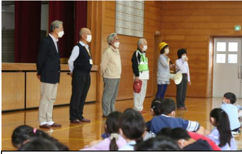
セーフティウォッチャーさんの紹介