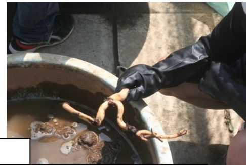
レンコンを植え付けます