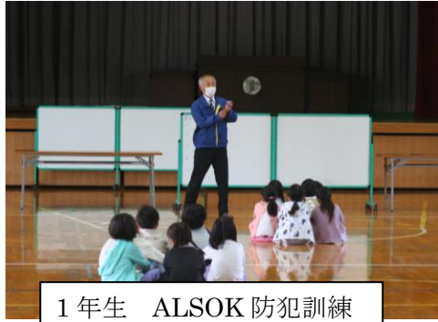
1年生 ALSOK 防犯訓練