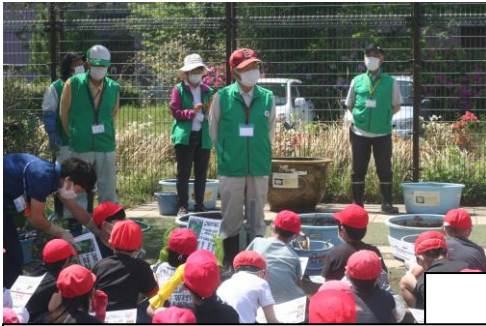
大賀ハスのふるさとの会のみなさん