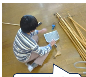
美化委員会 清掃用具点検