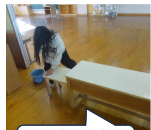
給食委員会 配ぜん台磨き！