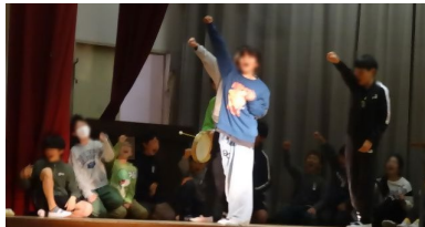
5年生 MIZUHO NEWSの時間です