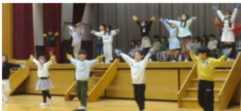
2年生 瑞穂のカリスマ・6年生クイズ