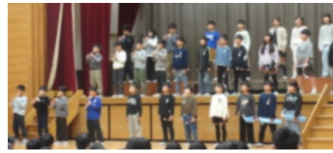
3年生 (演奏) Smile