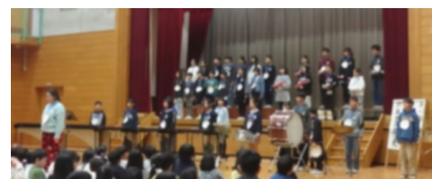
6年生 夢へ翔ける「ツバメ」