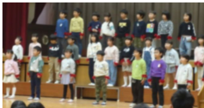
1年生 6年生にありがとうってつたえなきや