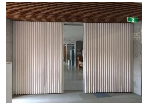
▲アコーディオンカーテン