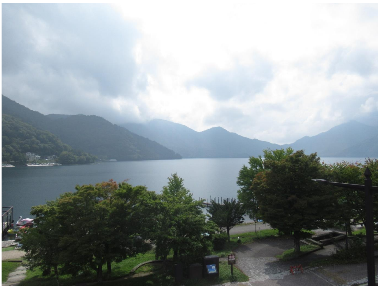
中禅寺湖をアップで・・・。