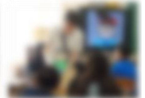
6年薬物乱用防止教室