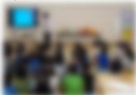
1,2年生おなか元気教室