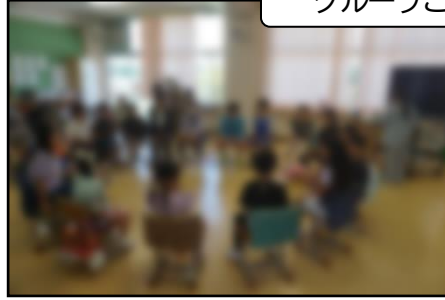
グループごとのゲーム