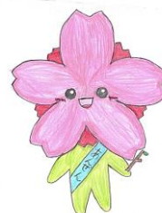
花見川小公式キャラクター はなっぴ

学校・家庭間連絡システム「すぐる」へのご登録ありがとうございます。現在、「すぐる」での配信は、学校や教育委員会等からの事務的なお知らせが中心となっておりますが、今後、保護者の皆様や地域の皆様に子供たちの様子をタイムリーにお伝えするツールとしても活用をしていこうと考えております。その際、緊急の連絡や重要なお知らせと判別がつかなくなることを防ぐために、子供たちの様子をお伝えする配信は、「はなっぴ通信」と表題を付けて配信いたします。ぜひ、ご覧ください。