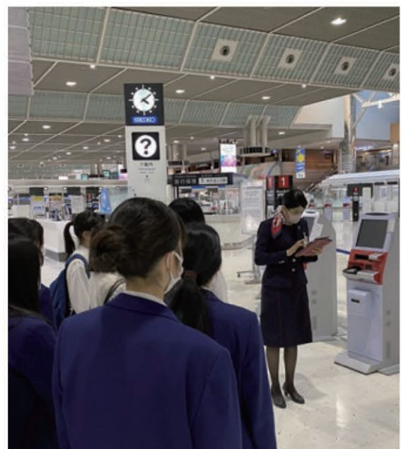
グローバル企業訪問 (成田国際空港見学会)