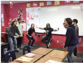
日本文化プレゼンテーション

英語を母国語とする国を訪問し、共に生活することで、英語力・異文化理解スキルの向上を図っています。また、異国の生徒とコミュニケーションを図り、国際的な友人関係の構築に努めています。