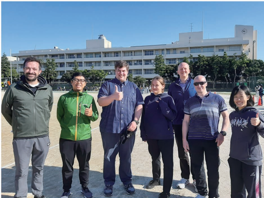
外国人教員による英語授業