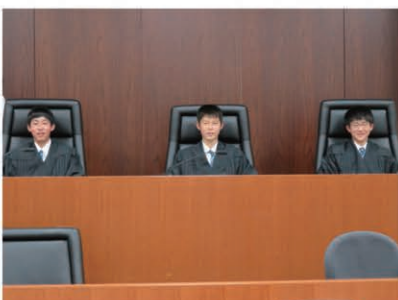
実際の職場を体感する活動