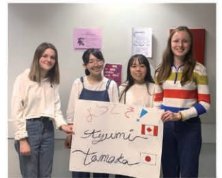
カナダ ホスト生徒と