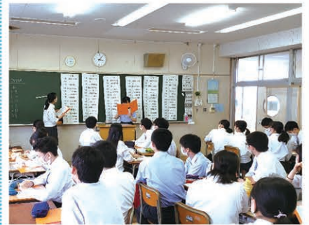
グループ活動を通じた生徒の主体的 な取組みにおけるプレゼンテーション

校内全域をカバーする高速インター ネット回線、一人一台端末、アクティ ブラーニングルームにより、主体的 ・対話的な学びをサポートします。