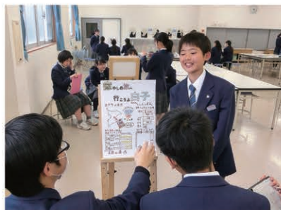
千葉の魅力を発信する活動