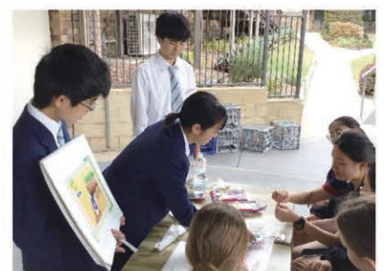
海外の中高生への日本文化の紹介