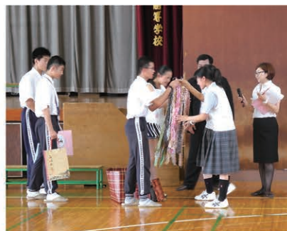
中国の生徒との交流