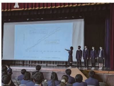
千葉市への政策提言