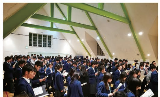
ブリティッシュヒルズ

授業、食事、自由時間、往復のバスの中など、すべて英語で過ごす英国疑似体験プログラムを通して、異文化を実体験し、学習の動機付けを図るとともに、国際感覚に富む人材を育成します。