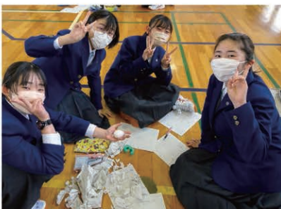
理数に特化した探究活動

✦ 答えが一つに決まっていない課題に取り組むことで実際の社会で必要とされる力を身に付けていきます。