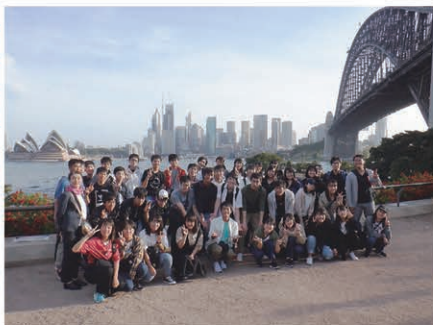
オーストラリア語学研修の様子