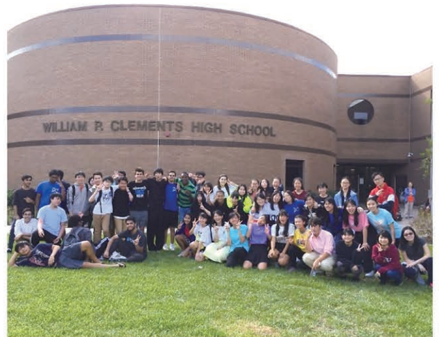
アメリカ ホスト生徒と