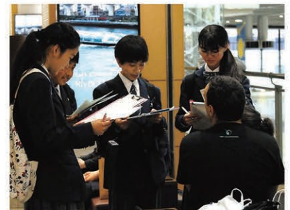
訪日客への英語インタビュー