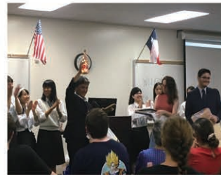
フェアウェルパーティー