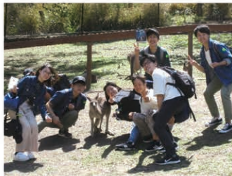
オーストラリア 動物園見学