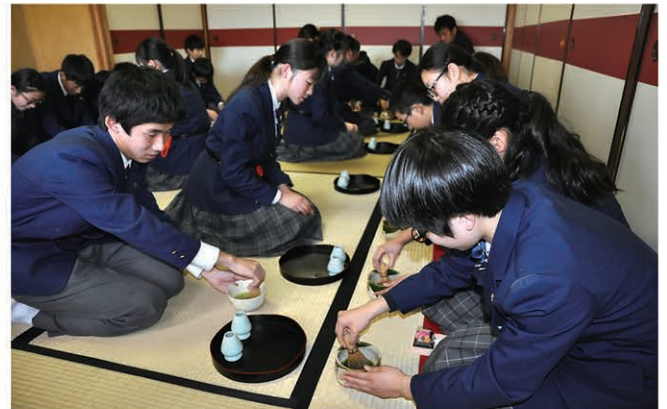
道プロジェクトの茶道体験

前期課程から国語に古典・書写を位置づけるだけ でなく、学習活動や学校行事を通して、日本の伝 統や文化を理解する機会を数多く提供します。