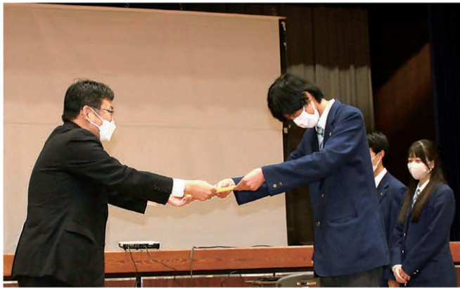
千葉市への提言 表彰式の様子

身近な生活圏に存在する課題を発見し、探究し 解決する活動実践を通して、幸せで豊かな未来を 切り拓こうとする力を育みます。