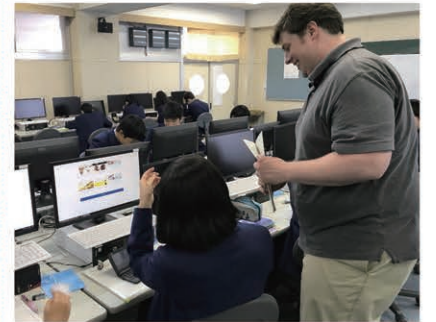
パソコンを活用した英語の授業

校内全域をカバーする高速インター ネット回線、一人一台端末、アクティ ブラーニングルームにより、主体的 ・対話的な学びをサポートします。