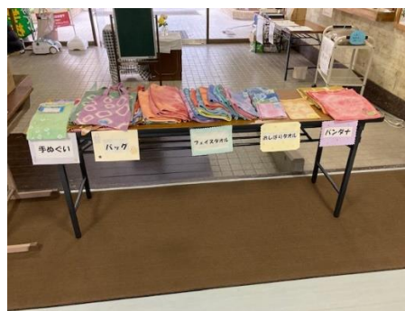
【製品のポップは本校美術部の作品】