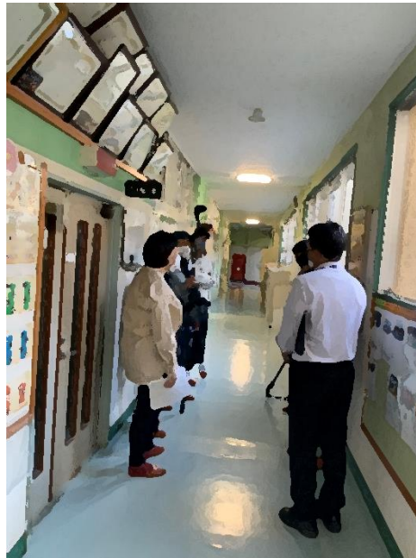
【取材を受ける教頭先生・背中】