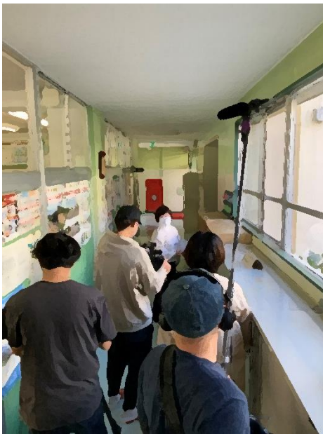
【取材を受けるSSSのHさん・奥】